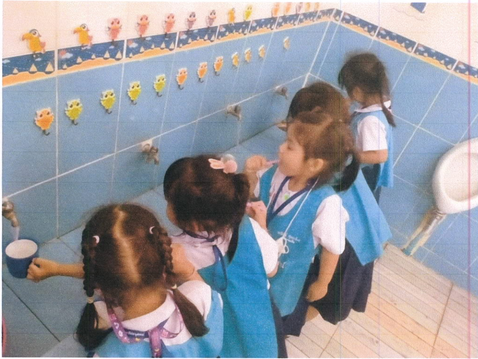
การแปรงฟัน