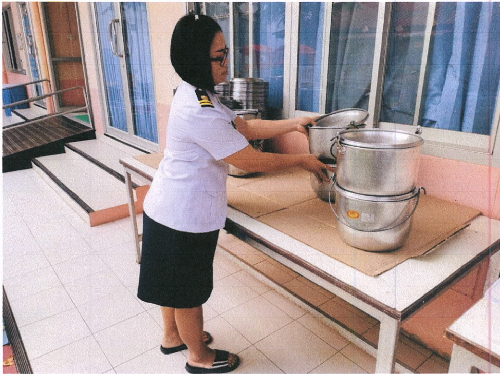
แต่ละห้องเตรียมอุปกรณ์ใส่อาหาร