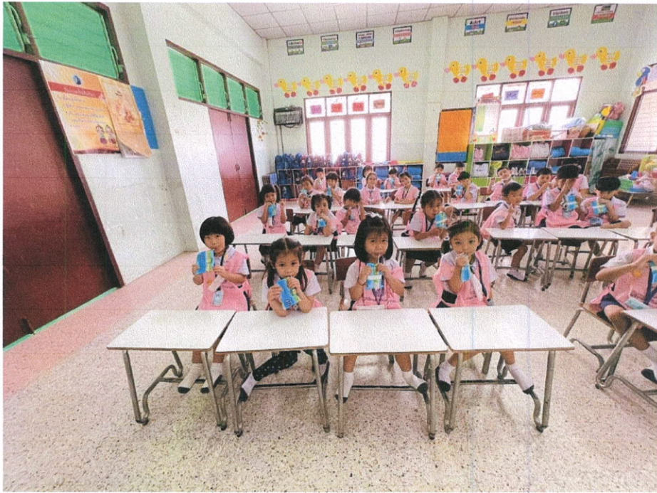
การดื่มนม