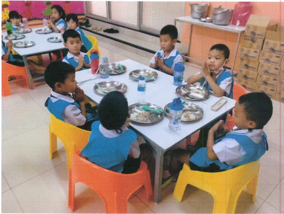
เด็กๆรับประทานอาหารเช้าอย่างเป็นระเบียบเรียบร้อย