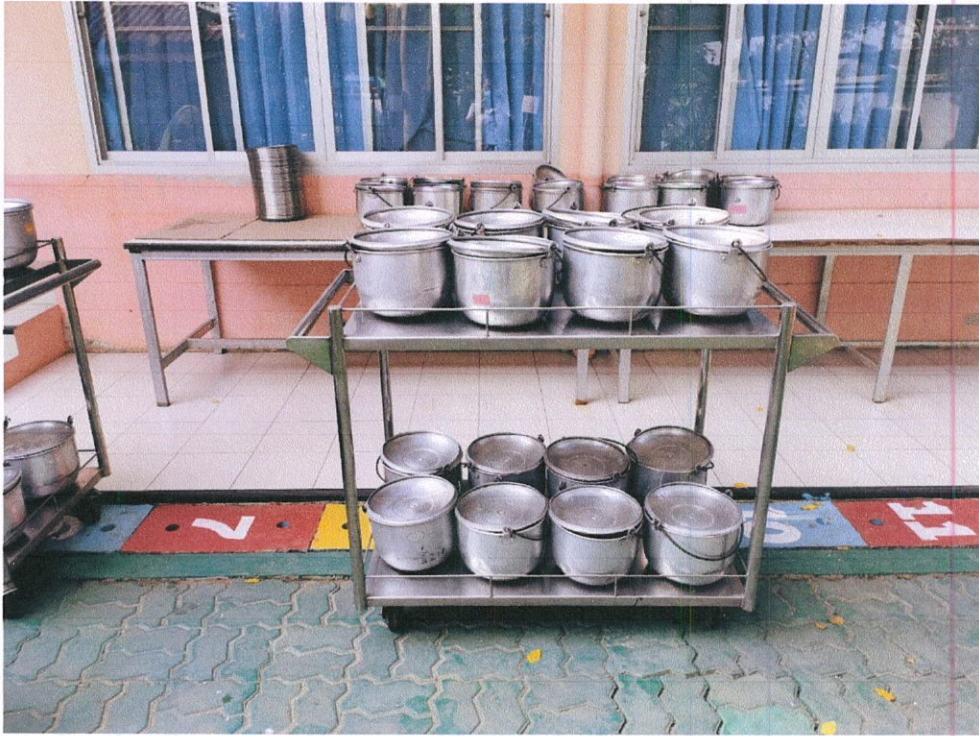
เจ้าหน้าที่เตรียมอาหารส่งตามห้อง