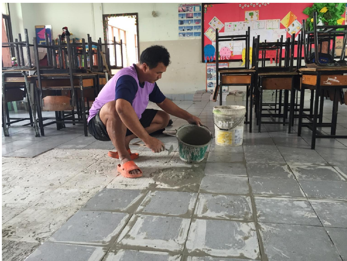
ซ่อมแซมกระเบื้องห้องเรียน