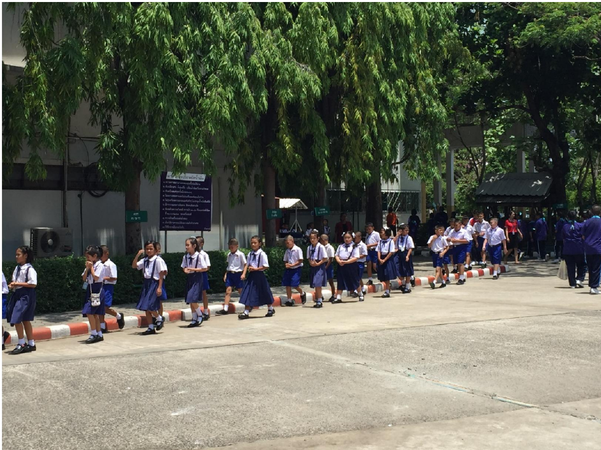
กิจกรรมตอนเช้า