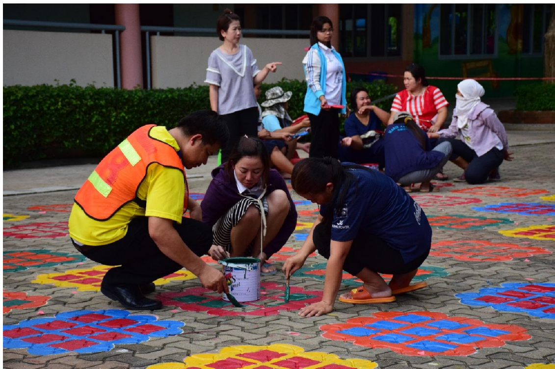
สร้างที่เรียนรู้ของน้องอนุบาล