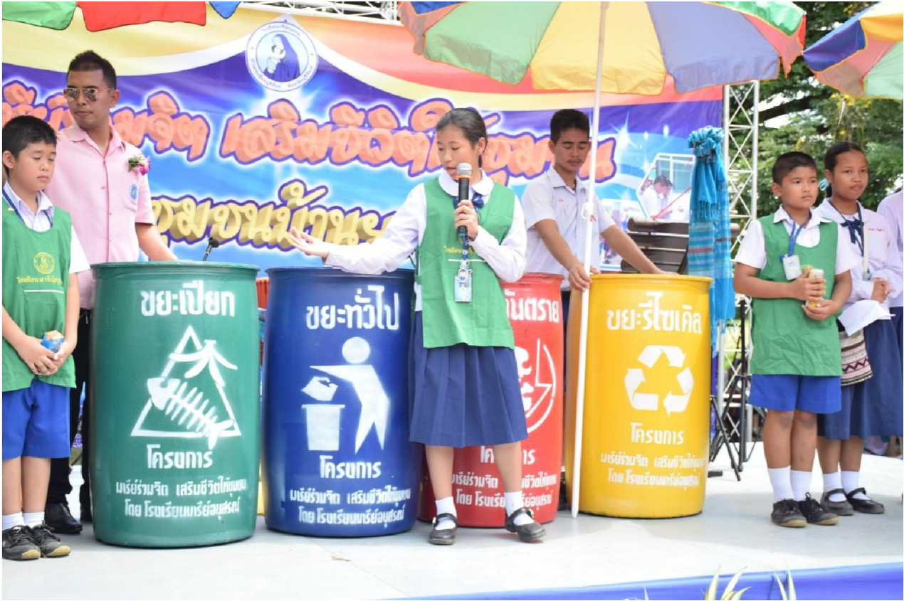
เริ่มต้นจากการอยากให้โรงเรียนสะอาด กลุ่มคนที่สะอาดด้วย