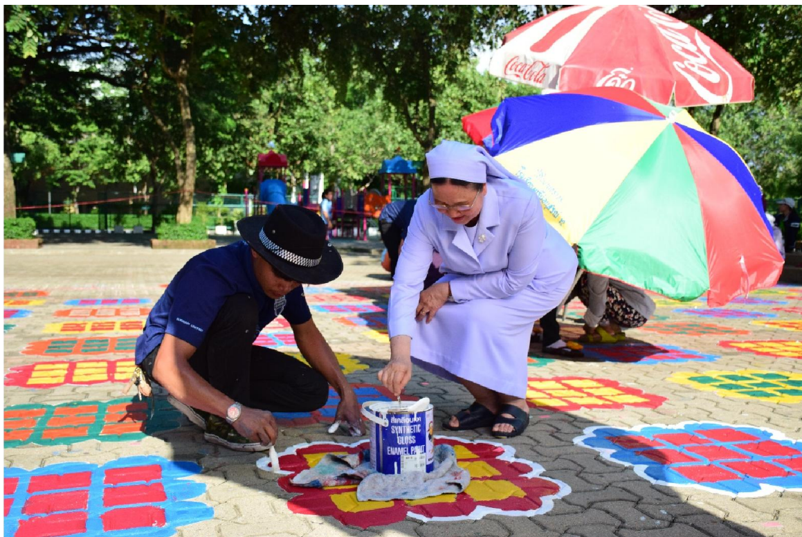
เขียนตารางเก้าช่อง