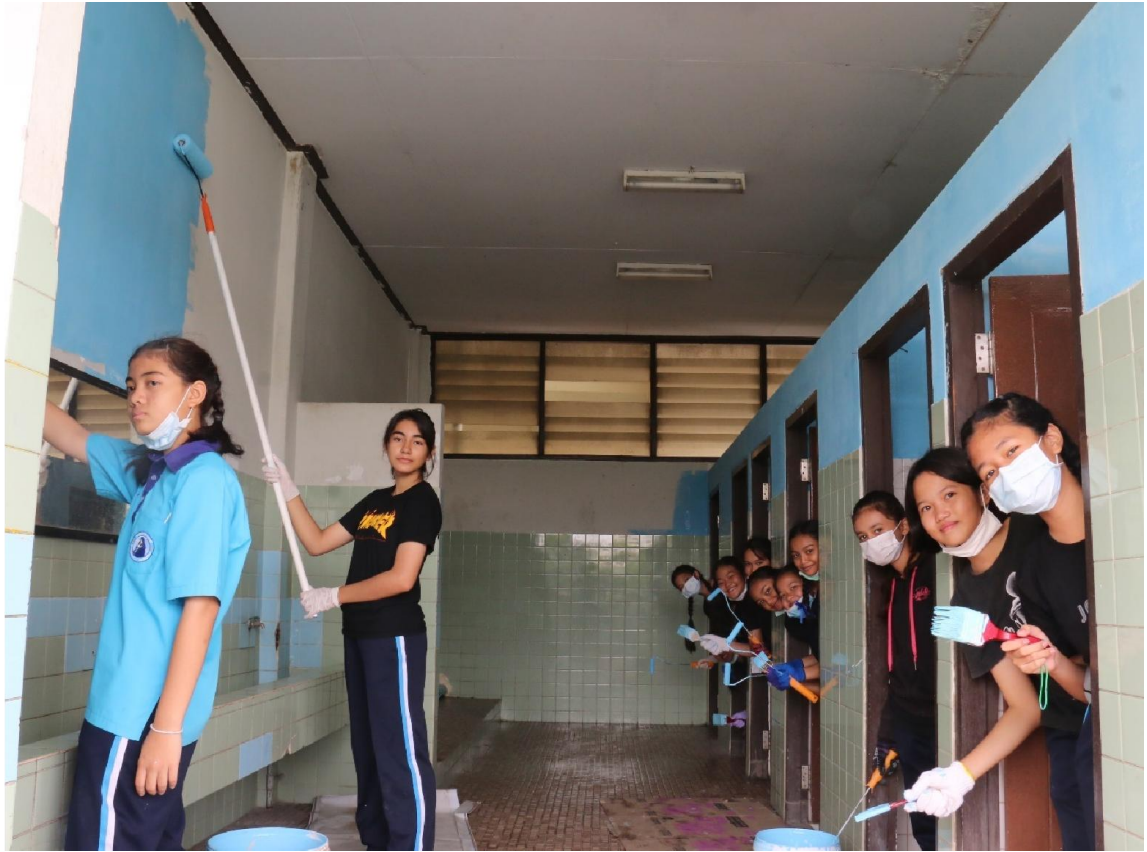
นักเรียนจิตอาสาช่วยทาสีห้องน้ำ