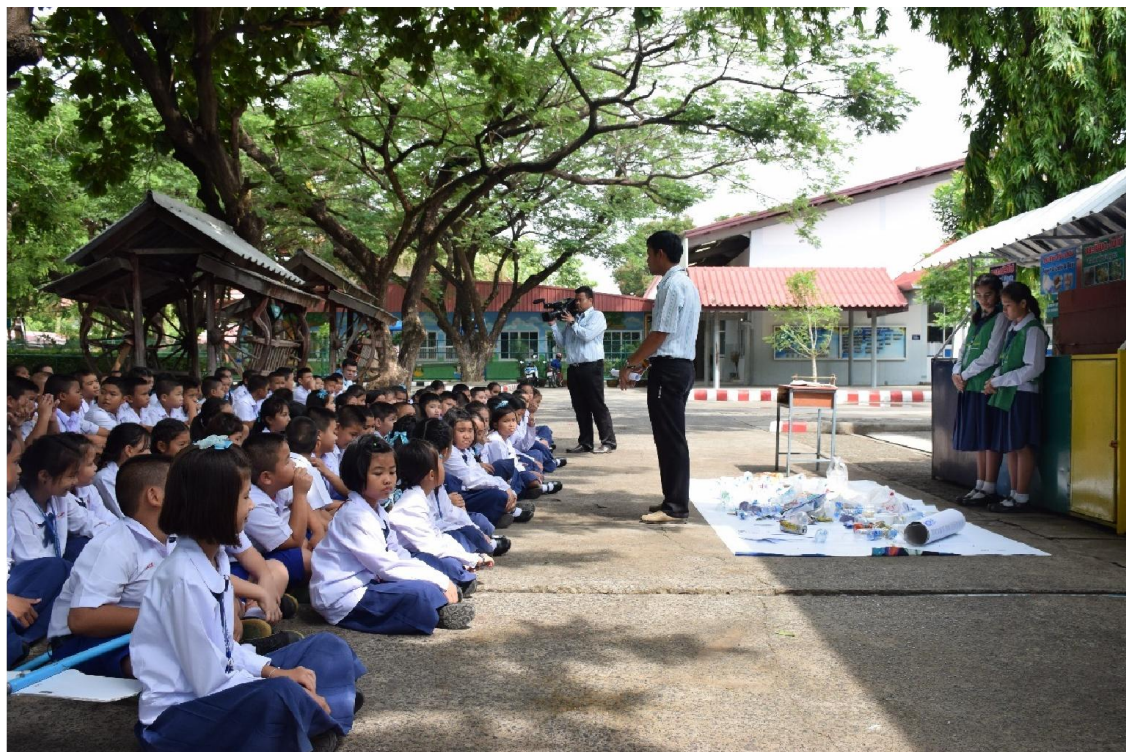
อบรมการคัดแยกขยะ