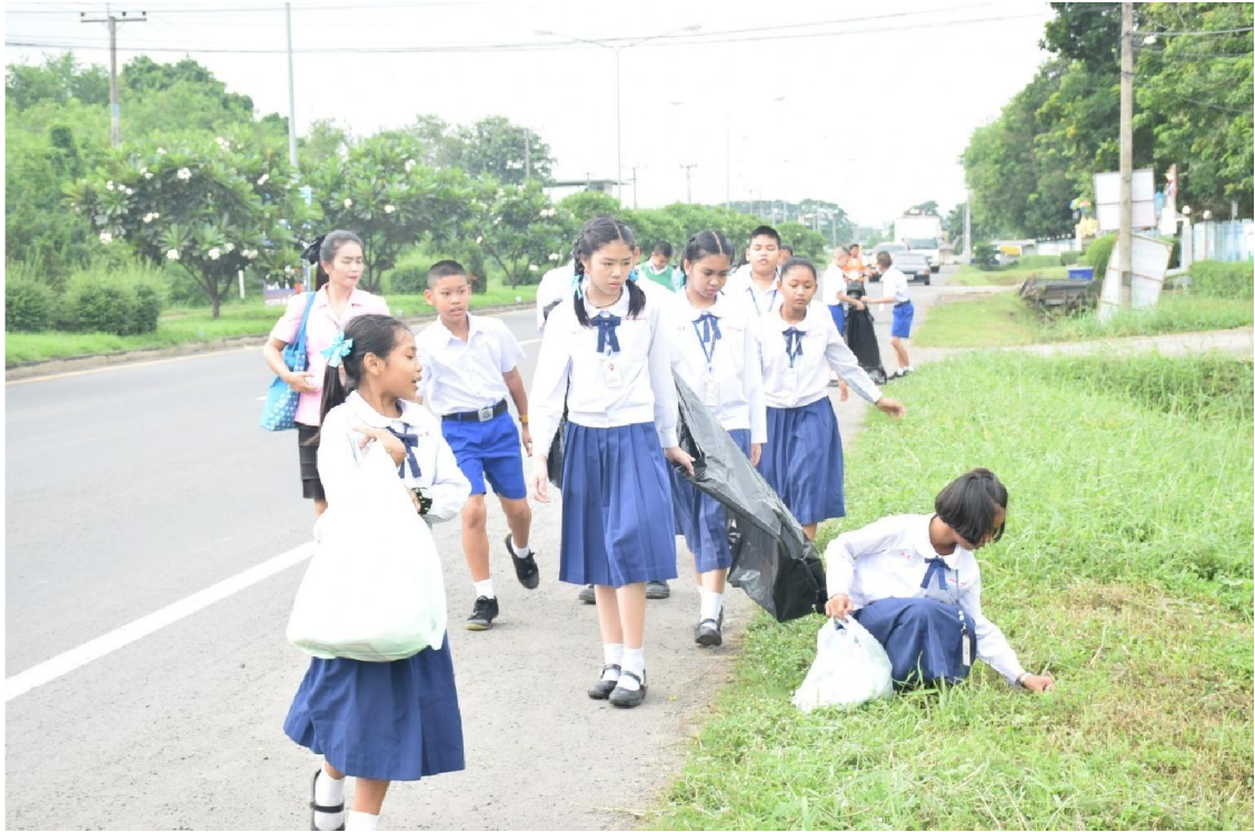
นักเรียนมีส่วนร่วมในการจัดสภาพแวดล้อม