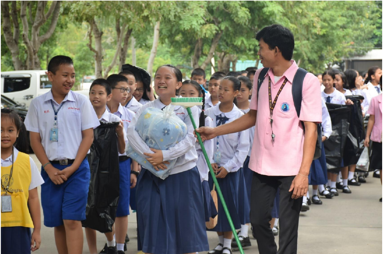
พร้อมมากะกับการช่วยกันในการสร้างบรรยากาศที่ดีให้กับโรงเรียนค่ะ