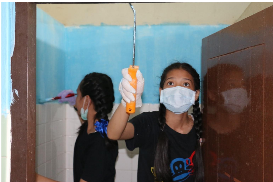
นักเรียนจิตอาสาช่วยทาสีห้องน้ำ