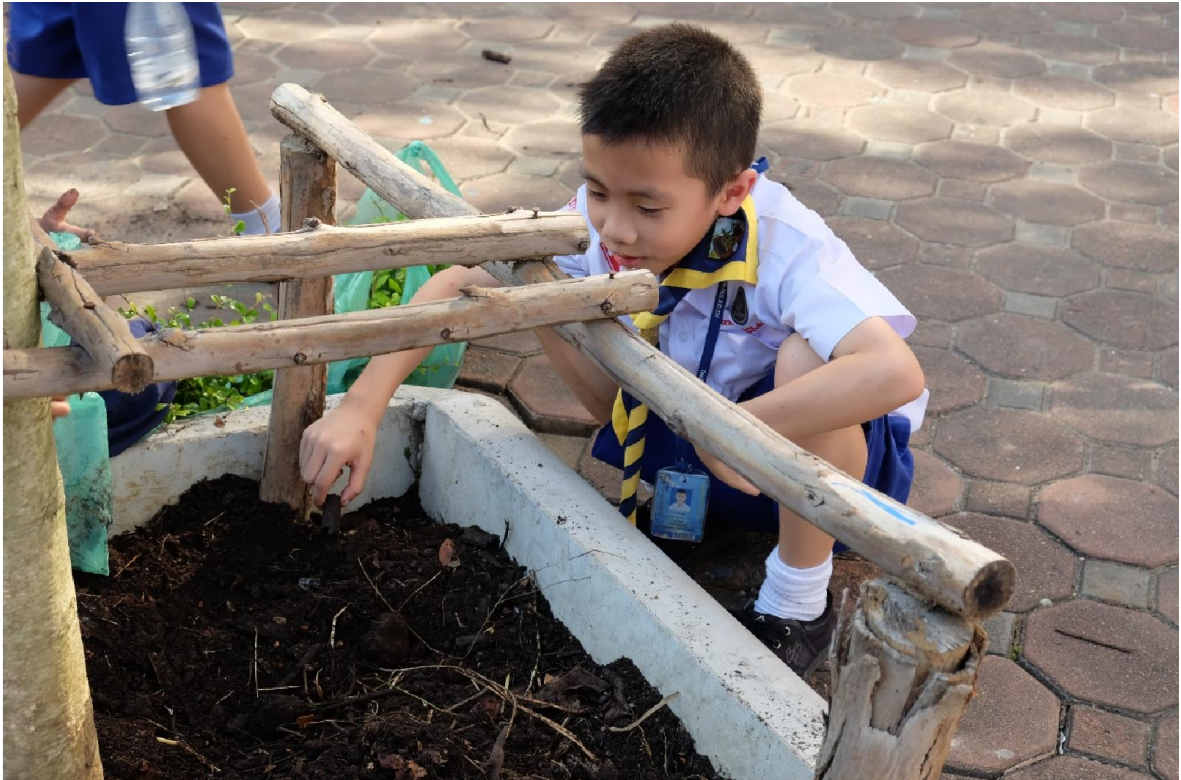
นักเรียนช่วยกันจัดสภาพแวดล้อมในโรงเรียน