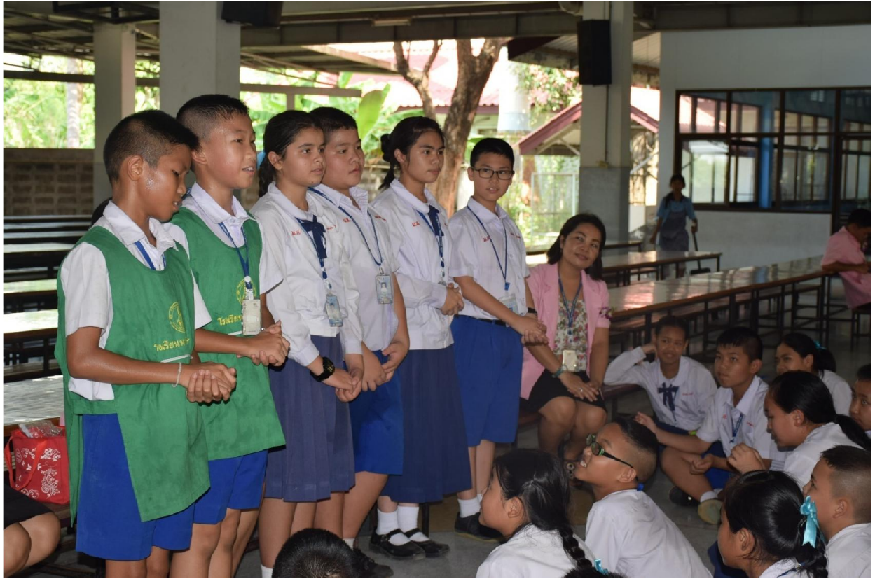
กลุ่มแกนนำนักเรียนที่อยากเป็นจิตอาสาในการเก็บขยะ