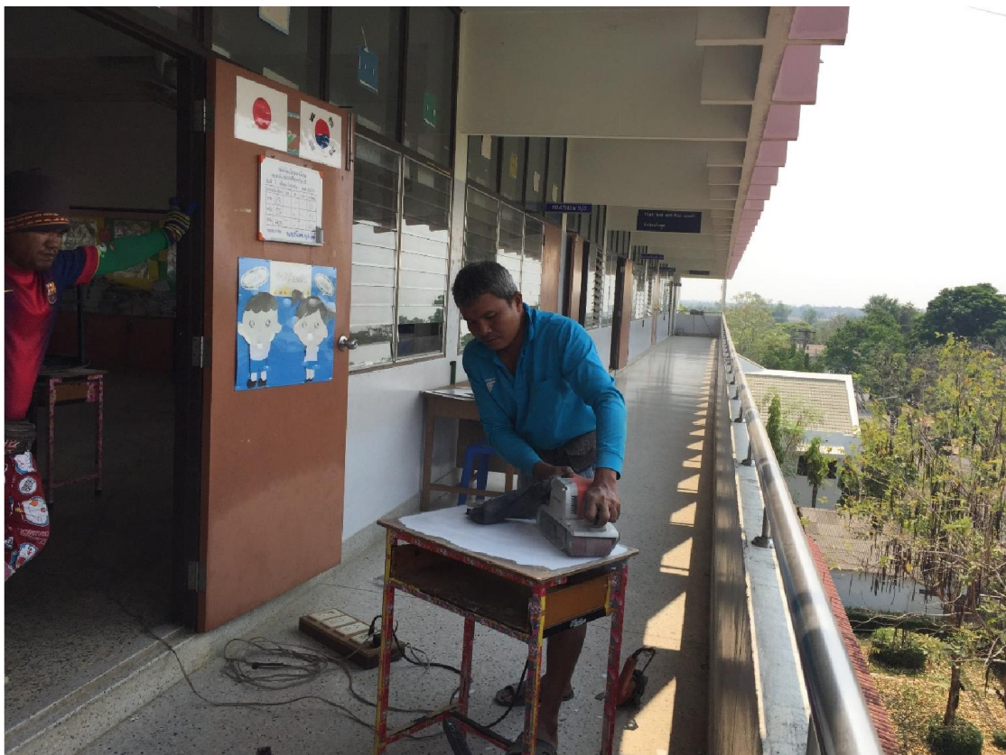
ซ่อมแซมโต๊ะเก้าอี้ที่ชำรุด