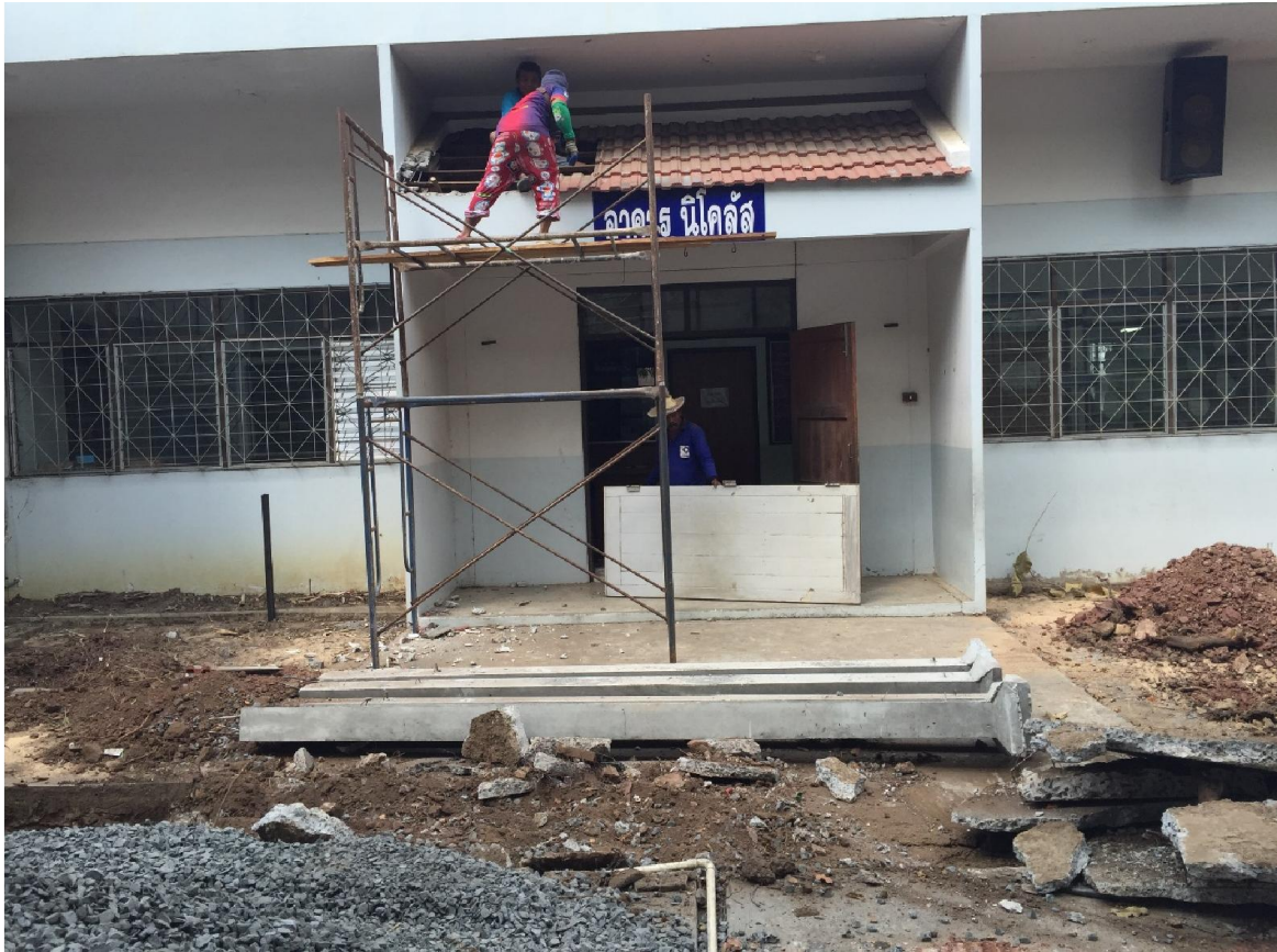
ซ่อมแซมอาคารนิโคลัส