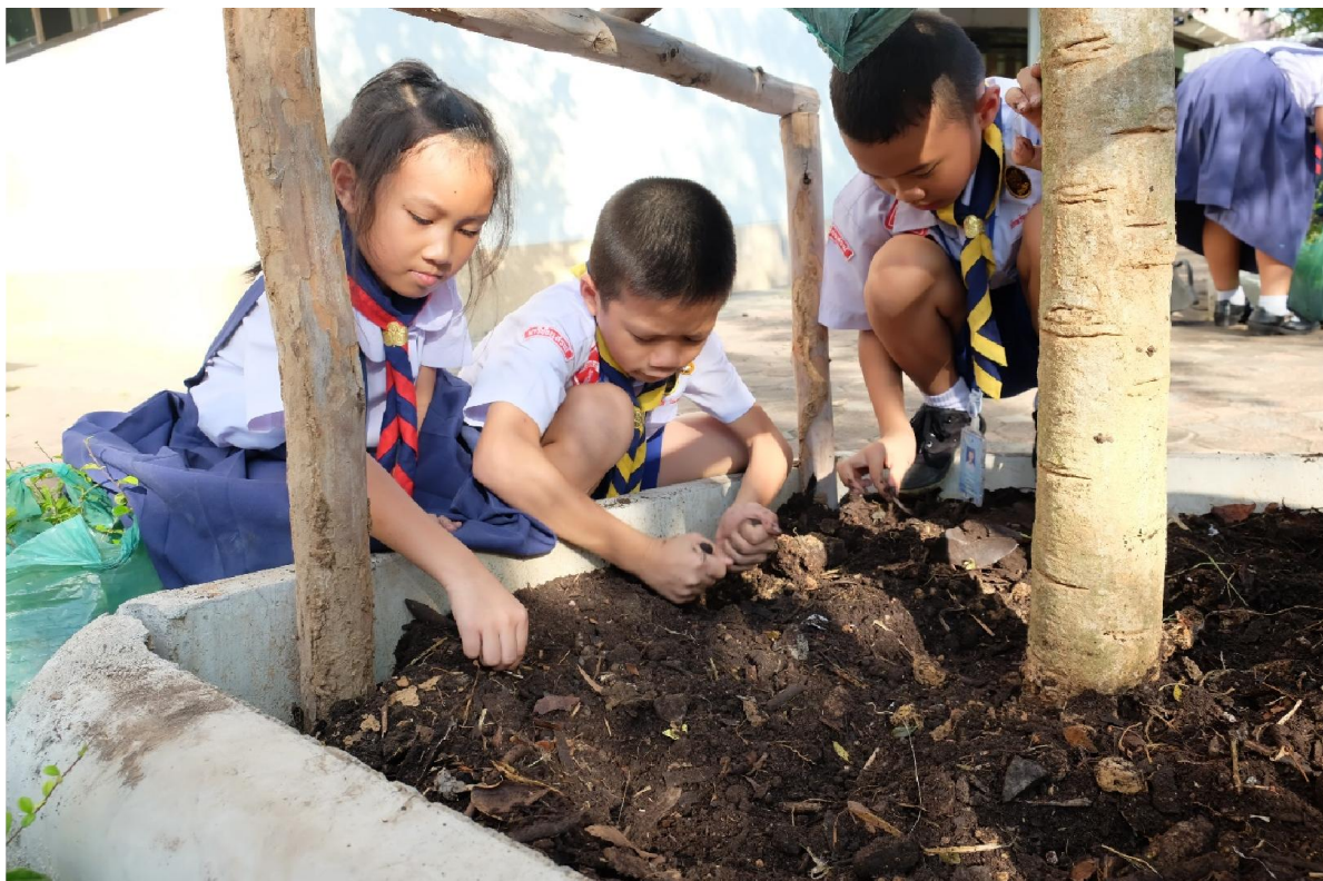
นักเรียนช่วยกันจัดสภาพแวดล้อมในโรงเรียน